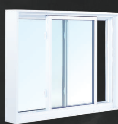
Fenêtre coulissante : Opérant simple à rabattement interne

Les fenêtres de la série 8000 Signature ont toutes le système d'ouverture du volet opérant à bascule facilitant l'entretien.