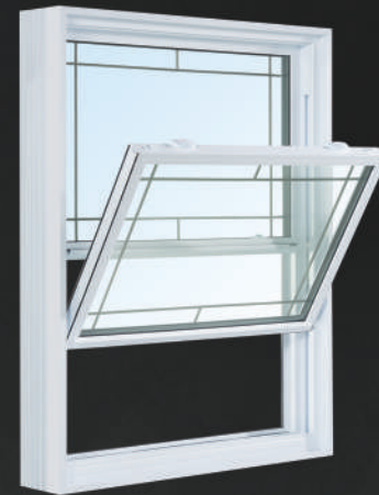
Fenêtre à guilotine : Volet du bas à bascule de rabattement interne

Optez pour la qualité! Offrez-vous les meilleures fenêtres de l'industrie!