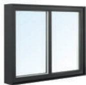
HT-8600 Coulissante simple hybride Cadre 6 po 1/8