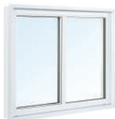
HT-8000 Coulissante simple 100% PVC Cadre 6 po ou 6 po 5/8