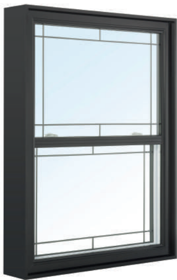
HT-8650 Guillotine simple hybride Cadre 6 po 1/8