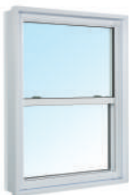
HT-8050 Guillotine simple 100% PVC Cadre 6 po ou 6 po 5/8