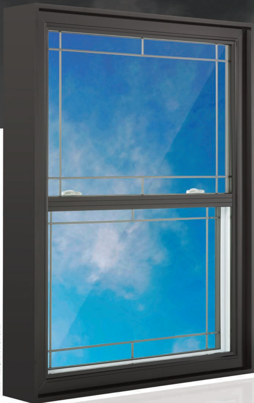
Modèle HT-8650 guillotine simple hybride

Les courbes coloniales du cadre, exclusives à Caron et Guay, offrent une touche distinctive et une finition impeccable. Pour accroître l'esthétisme de vos fenêtres, choisissez parmi la vaste gamme de moulures intérieures et extérieures que vous offre Caron et Guay.