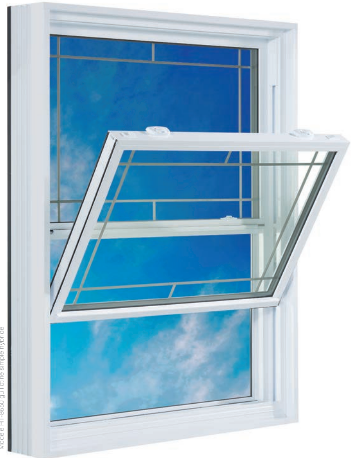
Modèle HT-8650 guillotine simple hybride