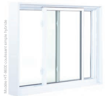
Modèle HT-8600 coulissant simple hybride

Opérant simple à rabattement interne qui facilite le nettoyage de l'intérieur de la maison.