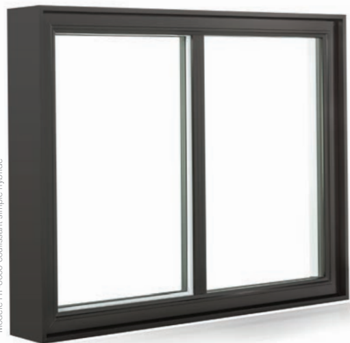
Modèle HT-8600 coulissant simple hybride