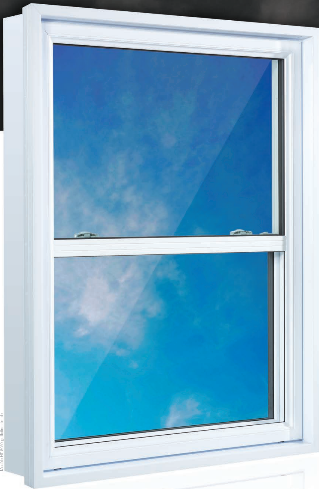
Modèle HT-8050 guillotine simple