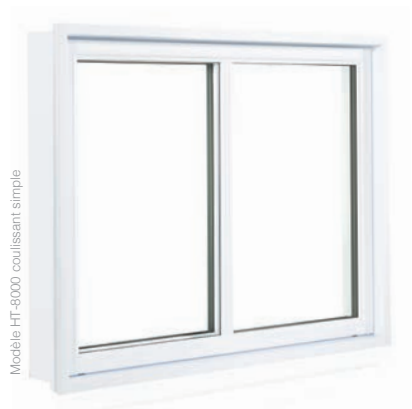
Modèle HT-8000 coulissant simple

Les courbes coloniales du cadre, exclusives à Caron et Guay, offrent une touche distinctive et une finition impeccable. Pour accroître l'esthétisme de vos fenêtres, choisissez parmi la vaste gamme de moulures intérieures et extérieures que vous offre Caron et Guay.