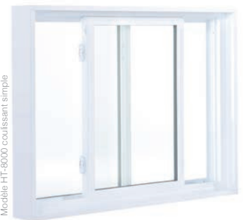
Modèle HT-8000 coulissant simple

Volet du bas à bascule de rabattement interne qui facilite le nettoyage de l'intérieur de la maison.